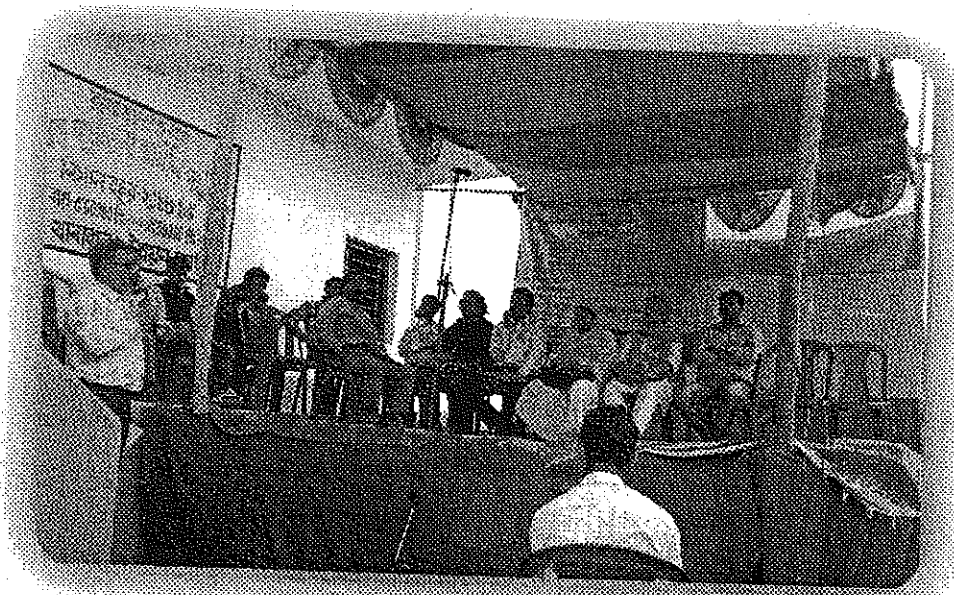
পাঠাগারের বাৎসরিক অনুষ্ঠানে মধ্যে উপস্থিত বিশিষ্ট ব্যক্তিবর্গ।